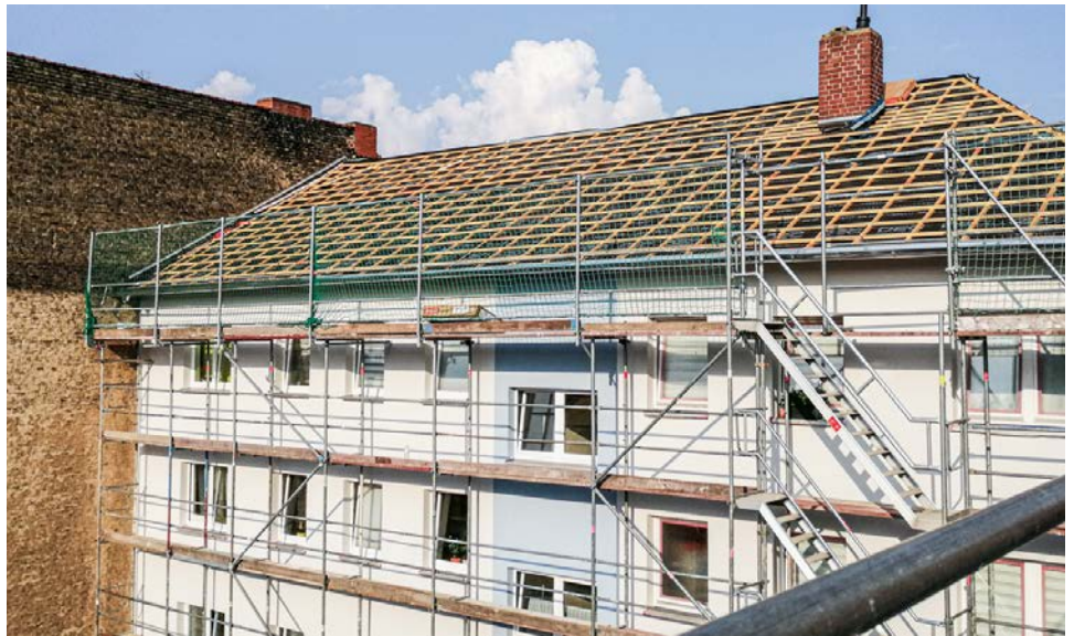
DACHSANIERUNG AM SCHLOSSPARK 137 UND DILTHEYSTRASSE 1-3A

Aber nach Wegfall unseres Großprojektes haben wir die Dacherneuerung als Ersatzmaßnahme durchgeführt. Die Gerüststellung haben wir ausgenutzt und die in die Jahre gekommene Fassade überarbeitet und neu gestaltet.