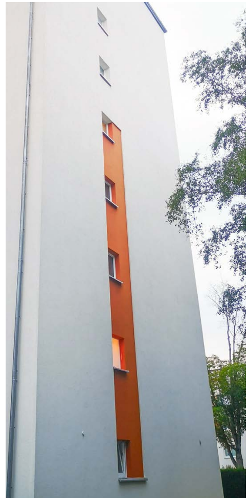
FASSADENREINIGUNG ZEHNTENHOF VORHER / NACHHER